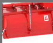
PROTECTOR TRASERO EXTRA RÍGIDO CON EXTENSIÓN