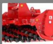
FORMA HELICOIDAL DE LAS PALAS DEL ROTOR