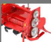
TRANSMISIÓN LATERAL DE SERVICIO PESADO POR ENGRANAJES CON ANCHO ADICIONAL