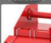
CASCO RESISTENTE, TUBO CUADRADO Y PLACA LATERAL