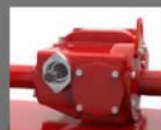
CAJA DE CAMBIOS DE SERVICIO PESADO, ADMITE TRACTORES DE HASTA 130 HP