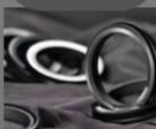
SELLO DE ACEITE MECÁNICO DE ALTA CALIDAD