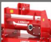
ENGANCHE DE TRES PUNTOS RÍGIDO Y RESISTENTE