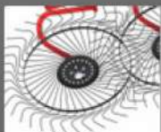
INTERCAMBIABLES INDIVIDUALES BRAZOS Y RUEDAS