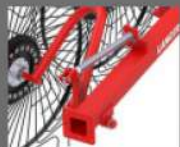
TRABAJO AJUSTABLE PRESIÓN CON RESORTE