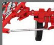
ANCHURA DE TRABAJO AJUSTABLE MECÁNICAMENTE